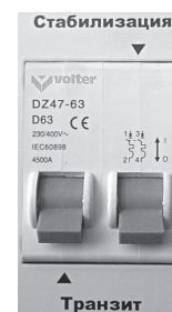
Рис.7. Отключены оба режима.