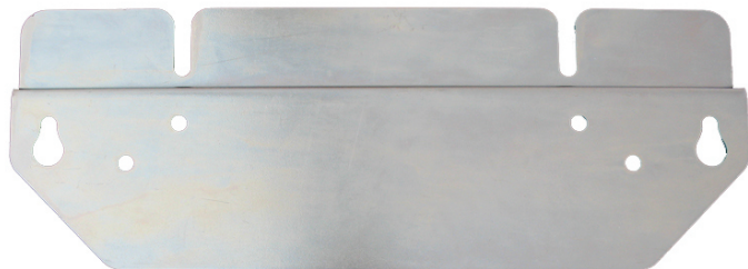
Рис. 2 Крепежная планка

Для размещения стабилизатора на стене сначала монтируется крепежная планка (Рис.2), потом на нее подвешивается аппарат и производится подключение токоведущих проводников. Предварительно на стабилизатор необходимо установить упорную планку (Рис.3).