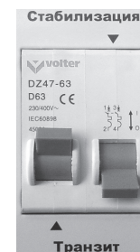
Рис.8. Режим «Транзит»