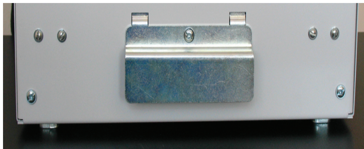
Рис. 3 Упорная планка