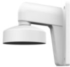
DS-1273ZJ-130-TRL Настенный кронштейн